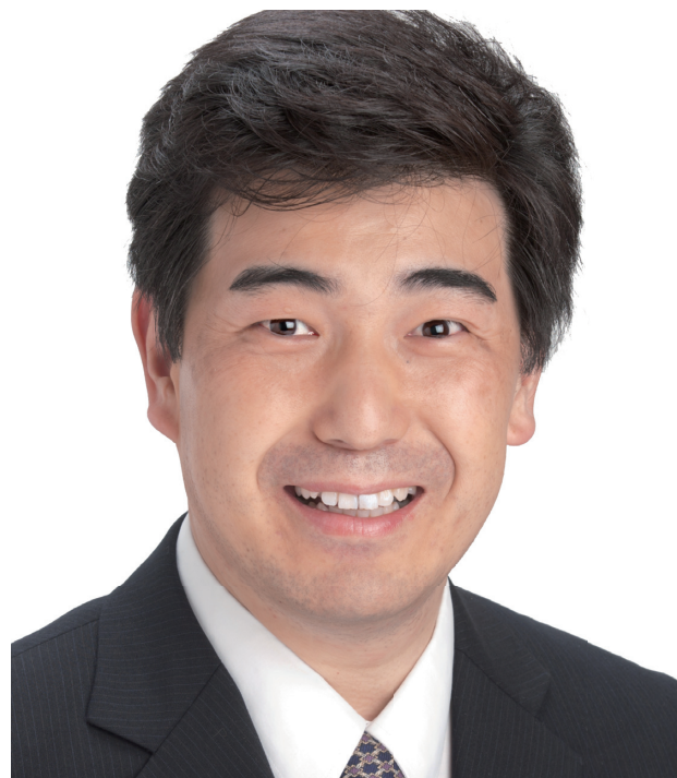
【活動地域】元郷、弥平、東領家、領家、朝日、末広、新井町、江戸、江戸袋、本蓮、赤井、東本郷、蓮沼、前野宿、東貝塚、大竹、峯、新堀、榛松 平川みちや事務所=弥平1丁目17番22号

●略歴● システムエンジニア／東京大学法学部卒／IT関連会社で働き従業員代表で奮闘／1972年行田市生まれ42歳。家族は妻・2女・義父母。