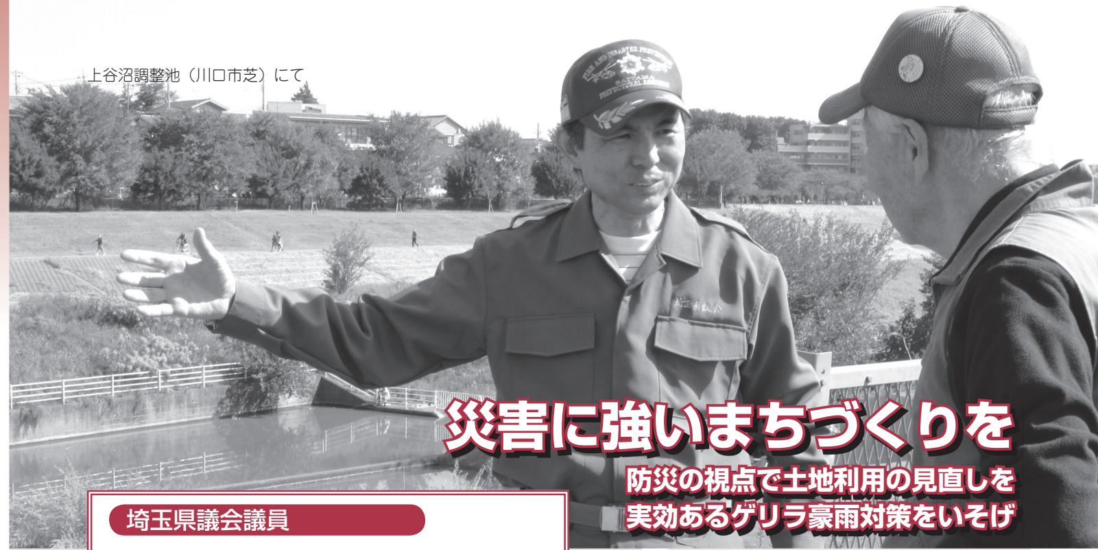
上谷沼調整池(川口市芝)にて