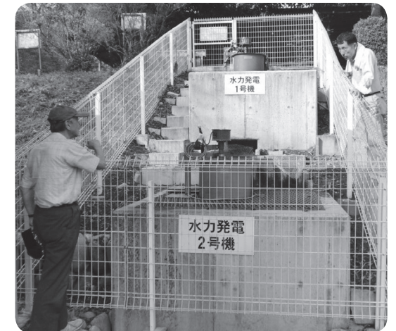
群馬県前橋市の「清流の里」小水力発電所

埼玉県の各地で太陽光による大手企業中心のメガソーラーが設置されています。党県議団は地域の事業者の力を引き出すために太陽光だけでなく、小水力などの多様なエネルギーへの支援を求めました。